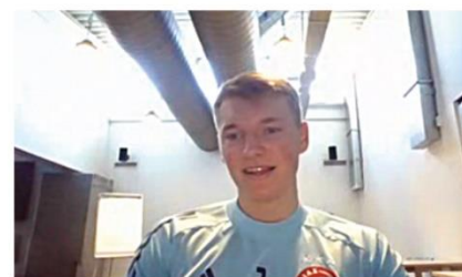
PERR SCHUURS VOETBALLER BIJ AJAX

Lange Limburger Perr Schuurs verruilde in 2018 Fortuna Sittard voor Jong Ajax. De veelbelovende centrale verdediger kreeg in 2020 een vaste basisplaats bij het eerste van Ajax en toen... brak corona uit. Vijf uitverkoren leerlingen, allen grote voetballiefhebbers en nog grotere Ajaxfans, mochten Perr vragen hoe hij de afgelopen tijd heeft beleefd.