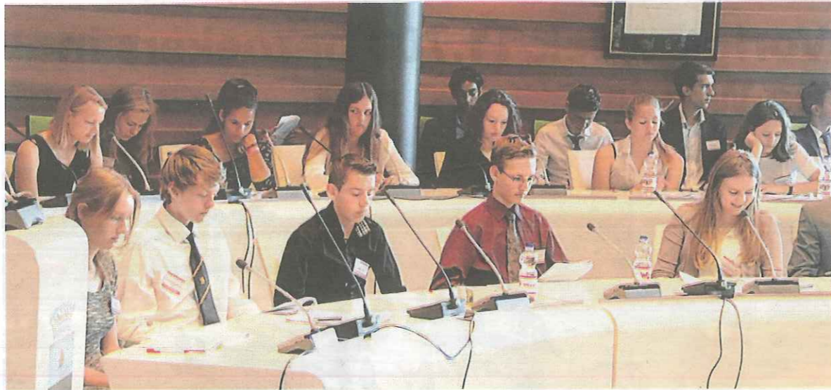
Scholieren in de raadszaal.

Bergschenhoek - Het Wolfert Lyceum Parlement werd dit jaar voor de tweede keer gehouden voor 4-VWO-leerlingen van het Wolfert Lyceum te Bergschenhoek. Op deze manier kunnen leerlingen kennis maken met het politieke bedrijf: van het schrijven van resoluties en het ontwikkelen van presentatievaardigheden tot het echte werk, het parlementair debatteren.