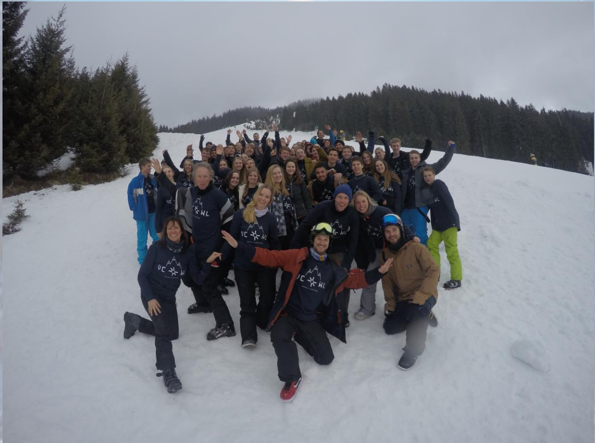
De groep tijdens de wintersportreis van 2016 boven op de berg voor het rodelen

Hebben jullie nog vragen na het lezen van deze brief dan zijn wij uiteraard bereikbaar per mail of telefonisch (fsm@wolfert.nl, T 010-3401440).