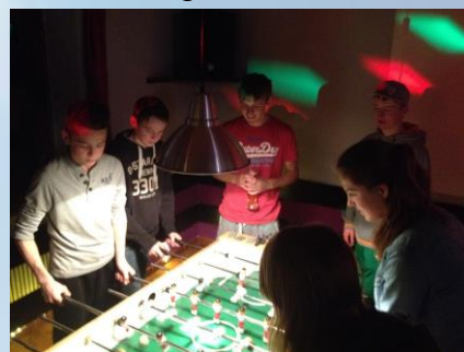
Tafelvoetbaltoernooi in de herberg

In de ochtend worden er groepjes met een begeleider gevormd waarmee iedereen op pad gaat. De groepjes kunnen door de leerlingen zelf worden gevormd, maar de begeleiding kijkt wel naar de groepsgrootte en het niveauverschil. De begeleiders kennen het gebied inmiddels erg goed en zijn er om te zorgen dat alles goed verloopt. Ze bepalen niet waar de groep heen gaat, want het is tenslotte vakantie! De beginners worden in de ochtend opgewacht op de piste door een instructeur en krijgen twee x twee uur dagelijks les, dat in overleg kan worden ingedeeld.